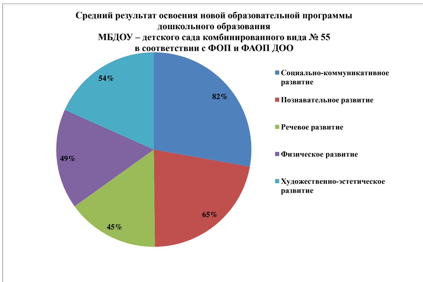
Диаграмма № 1 Средний результат освоения программы по группам.

Вывод. Показатели педагогической итоговой диагностики показали удовлетворительные результаты, программы МБДОУ реализованы в полном объеме.