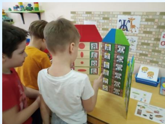
«Домики для звуков»