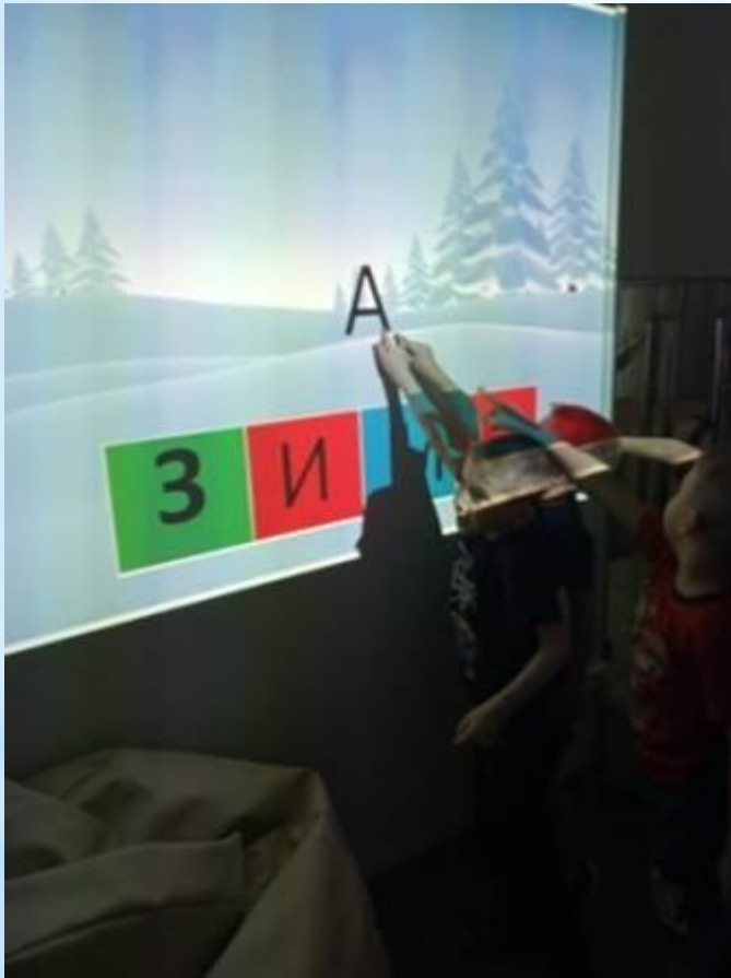
Обобщающая игра-квест «Зима»