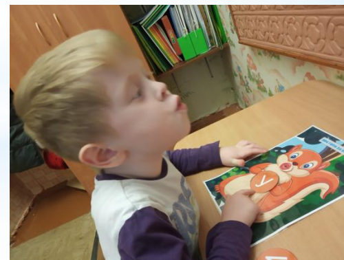
«Учим гласные звуки с белочкой»