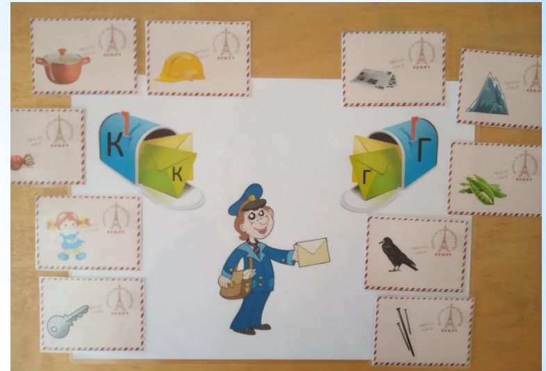
Игра: «От кого письмо?»