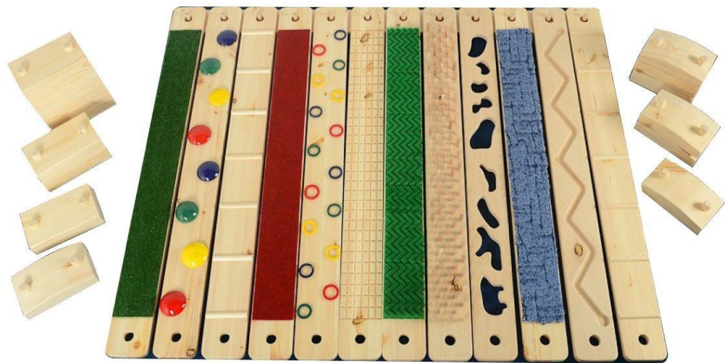
Тактильный комплекс «Солнышко»